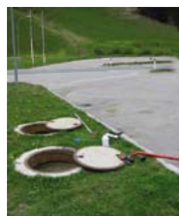
▲ Probeziehungsort Ölabscheideranlage wird überprüft