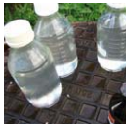
▲ Gezogene Proben fertig für den Transport in unser Labor