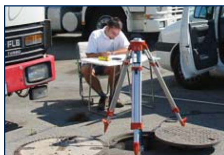
▲ Bestens geschultes Personal und professionelle Beratung vor Ort

Alle Preise excl. Ust., technische Änderungen, Druckfehler und alle Rechte vorbehalten.