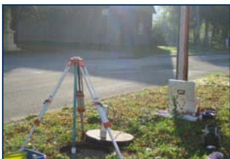
▲ Prüfanordnung Dichtheitsprüfung mit modernstem Prüfgerät