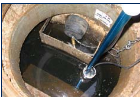
▲ Prüfsensor misst Wasserstand auf 0,1 mm genau