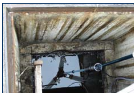
▲ Ölabscheider-Dichtheitsprüfung mittels Drucksensor im überstauten Zustand