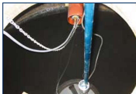
▲ Während der Dichtheitsprüfung Verschluss des Systems mittels Druckblase

Die von uns eingesetzten Geräte werden laufend vom Bundesamt für Eich- und Vermessungswesen geprüft, kalibriert bzw. geeicht, wodurch eine ständige Qualitätskontrolle gewährleistet ist. Zusätzlich wird jährlich eine Vergleichs- und Eignungsprüfung, die die ÖNORM B 2503 vorschreibt, durchgeführt. Dazu setzen wir modernste EDV Technik und Aufzeichnungsgeräte ein, sodass sich eine lückenlose nachvollzieh- und überprüfbare Protokollierung des Prüfablaufes ergibt.