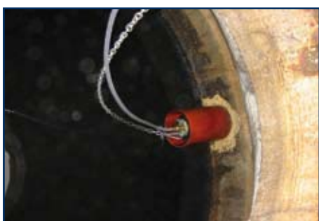
▲ Nachweis der Dichtheit nach Sanierung von Behältern (z.B. Rohrdurchführung)